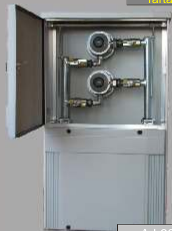
AJ 600 Plus K ížik RTP25D

Uliné regulačné zostavy ( URZ ) sú určené na regulovanie tlaku zemného plynu s najvyšším vstupným tlakom do 0,4 MPa na výstupný tlak 2 – 30 kPa. Pri výrobe URZ sú použité len kvalitné a certifikované komponenty, ktoré zaručia vysoký štandard a vysokú úžitkovú hodnotu výrobkov.