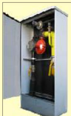
AJ 600 Plus Francel Regal2