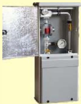
AJ 400 Plus Gazgép KHS100