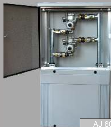
AJ 600 Plus Tartarini R/25