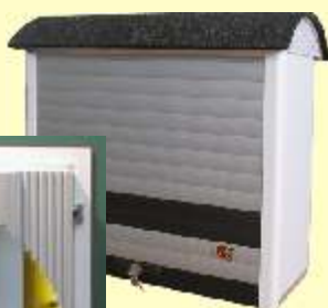
roletové zatváranie Zatváranie roletami

Uliná regulačná zostava - URZ je určená na zásobovanie odberateľa s väčším odberom plynu. Možno ju tiež použiť na posilnenie tlaku plynu vo verejnej plynovodnej sieti. Každý regulačný rad je vybavený guovými uzávermi s možnosťou uzatvorenia každého radu zvlášť. URZ sú vybavené dvomi až štyrmi paralelne prepojenými regulátormi Tartarini, Kížik, Gazgép, SamGas s výkonmi od 10 do 70 m 3 /hod, alebo jedným väčším regulátorom Tartarini R/70, Tartarini B/249, Francel Regal2 a iné.