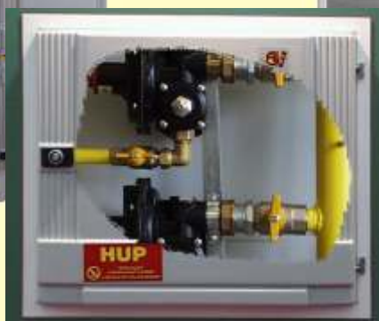
AJ 600 NS Tartarini R/70