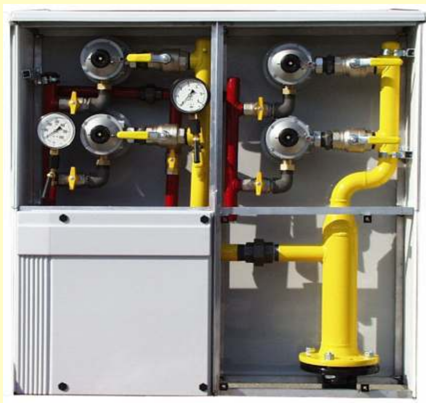
AJ 1000 Plus K ížik RTP40D