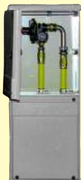
AJ 400 Plus Tartarini R/70