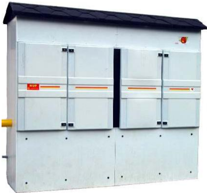
REGULAR® City Box-II