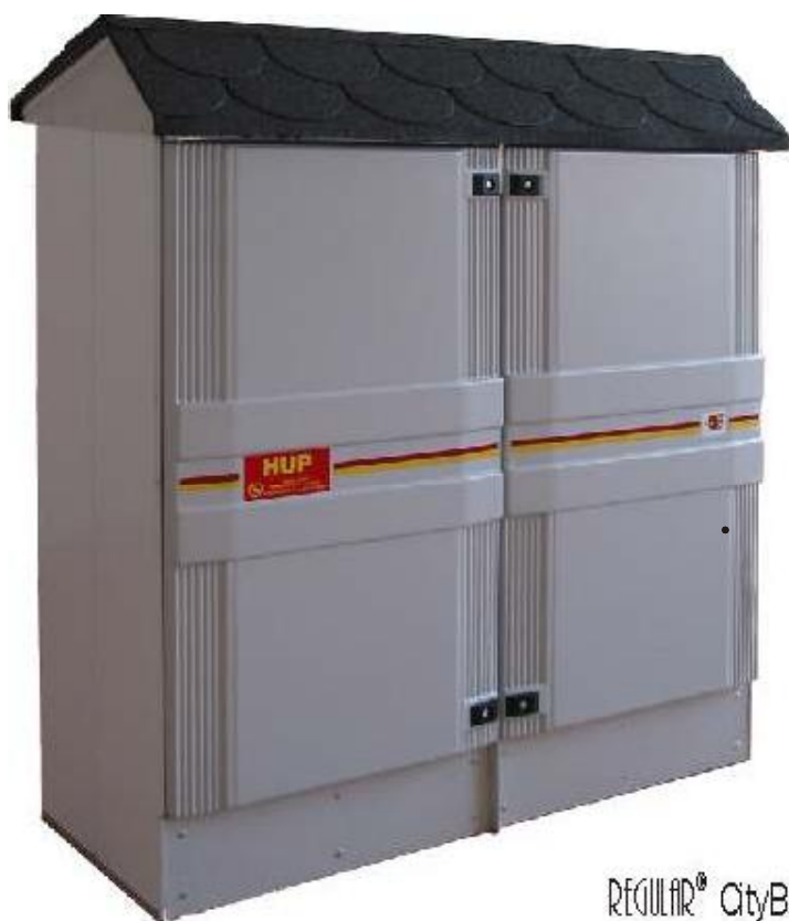
REGULAR ® CityBox