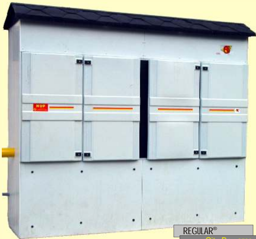
REGULAR® City Box 2500