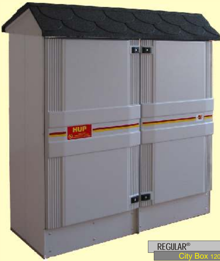
REGULAR ® City Box 1200